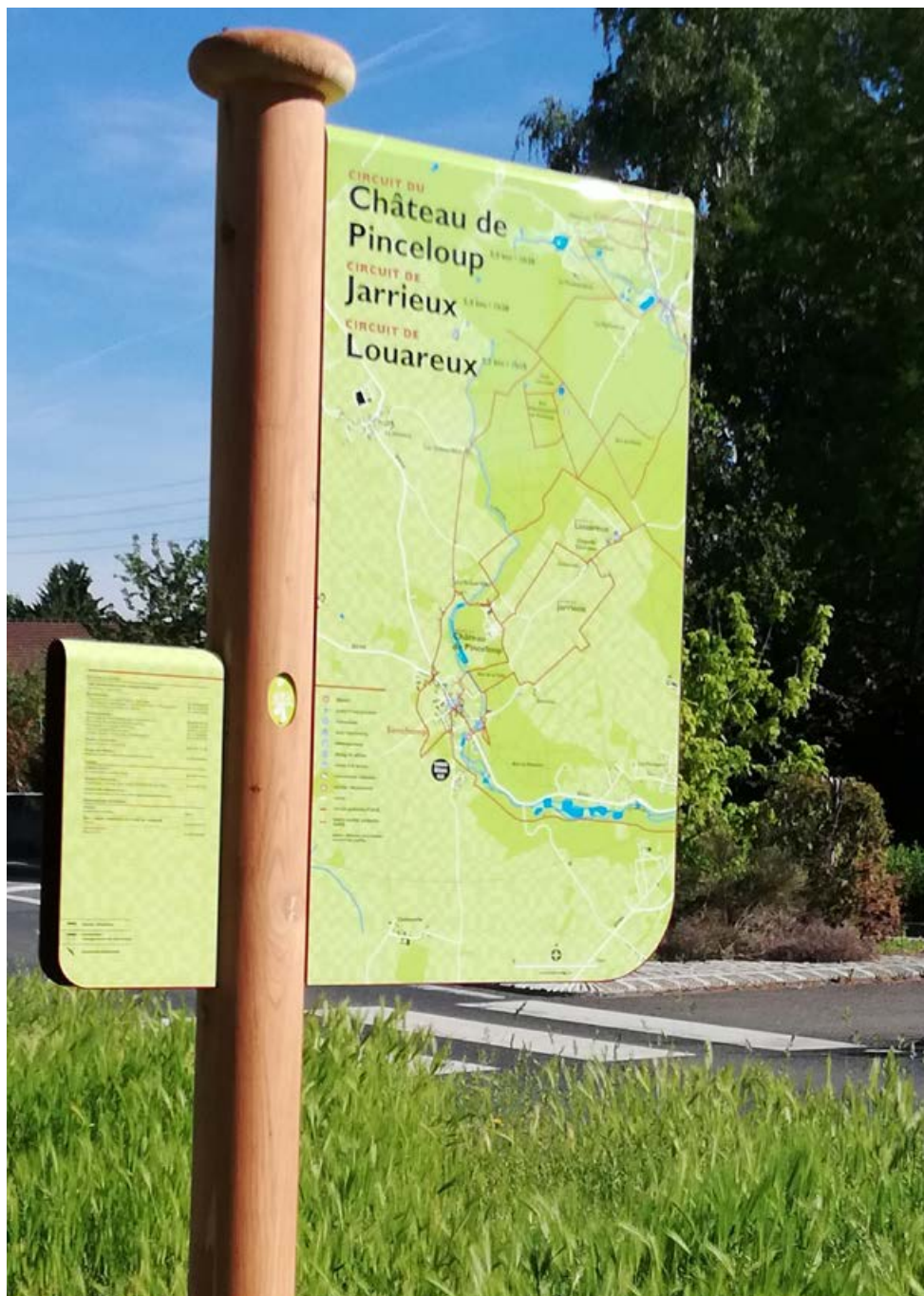
Projet mené à bien, en partenariat avec la mairie et le PNR